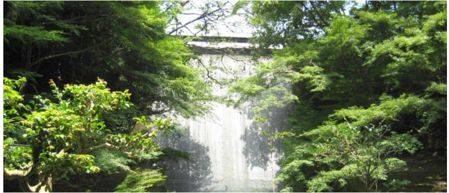
15.5mの高さのコンクリートダムから流れ落ちる波紋が美しい

6月4日、本年度第1回目の施設見学会が「瀬戸市馬が城浄水場」で行われた。当浄水場は、昭和8年完成した瀬戸市の水道の始まりです。ここは、毎年水の週間の日曜日にしか公開しない施設です。また、加えて瀬戸市の観光名所でもあります。