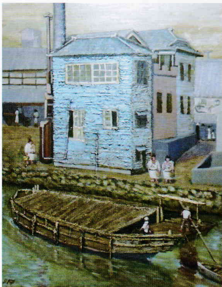
堀川の記憶—弁慶湯 画・藤 弘幸

暑い夏でも、いつもと違ったなつかしい風が心に吹く8月。夏休みの暑気払いに堀川文化の紙芝居を親子でいかがですか。「納屋橋を作った彦作さん」「本町通を象が歩いた」「碁盤割と札の辻」「桜通と桜天神」「橋町と橋座」の5点の紙芝居が、みなさんを百年前までの名古屋の町にご招待します。会場に紙芝居を展示して、五条橋畔にありし日の夏の弁慶湯を描いた油彩画や、堀川端わらべうた・名古屋甚句などの音楽も楽しめます。朗読つきの紙芝居を映像で見たり、古写真や絵図も展示します。