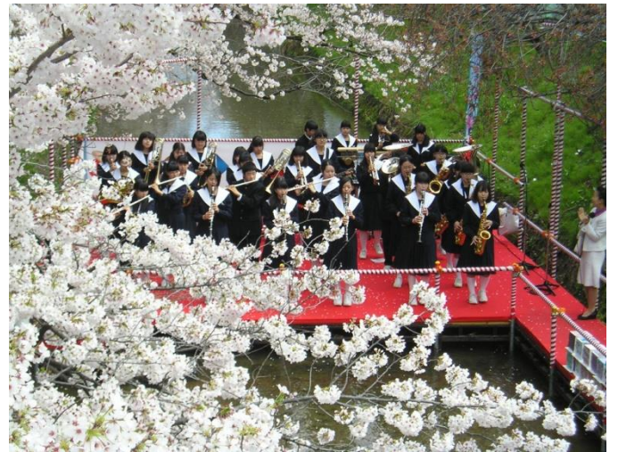
地元中学生による、吹奏曲のおもてなし・・・

好天に恵まれた4月4日(土)恒例の「黒川友禅流し」が北区の黒川沿いで行われ、多くの名古屋市民で賑わいました。川の中央には今年も川床が設けられ、地元中学生が吹奏楽でおもてなしをしてくれ、或いは又、箏曲の演奏等で川岸は大勢の人・人・人で埋まりました。多くの屋台から食欲をそそる良い匂いに祭の雰囲気は絶好調でした。我々 鯉城・堀川と生活を考える会の皆さんも多数参加を戴きました。