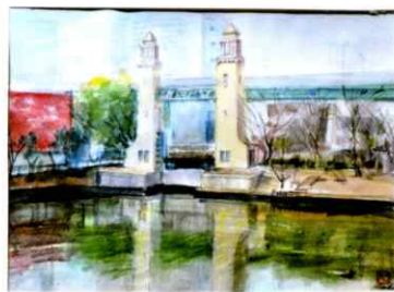
「松重閘門」 F4 透明水彩