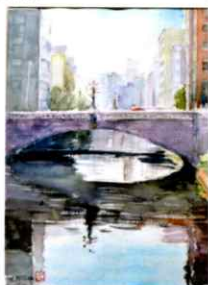
「桜橋」 F4 透明水彩