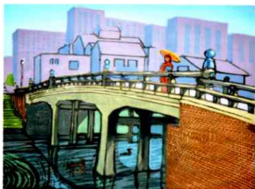
「堀川五条橋」 F5 多色木版画