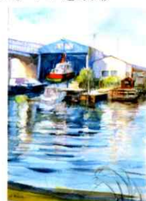
「千年の造船所」 F4 透明水彩

堀川の魅力を版画と水彩で表現してみました。 上流（黒川樋門）から河口（防潮水門）まで 16キロのポイントを約20点展示します。