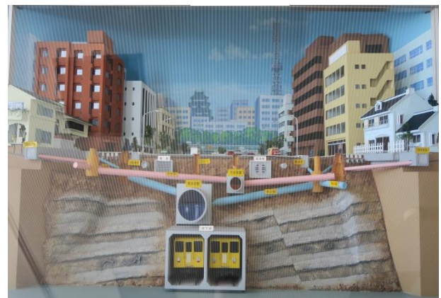
(分流式下水道の断面)