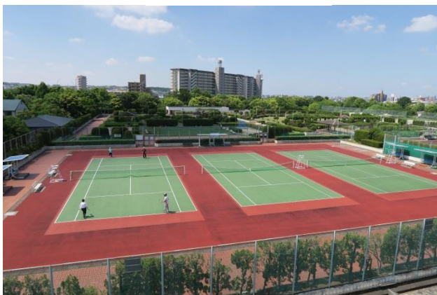
(テニスコート・憩いの広場)