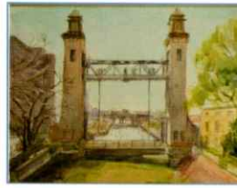
「松重開門から見た中川運河」