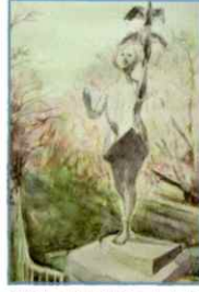
「黒川 瑠璃光橋の少女像」