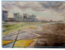
「夕暮れ時の瀬戸川」