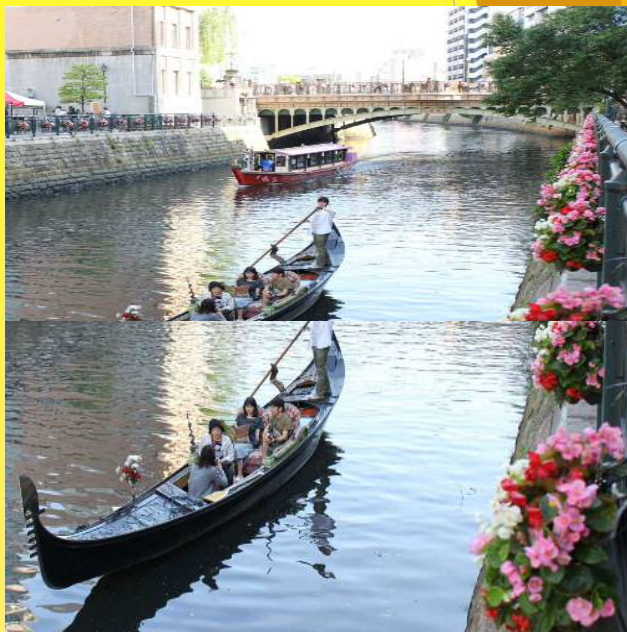
ゴンドラや屋形船が行き交う現在の堀川