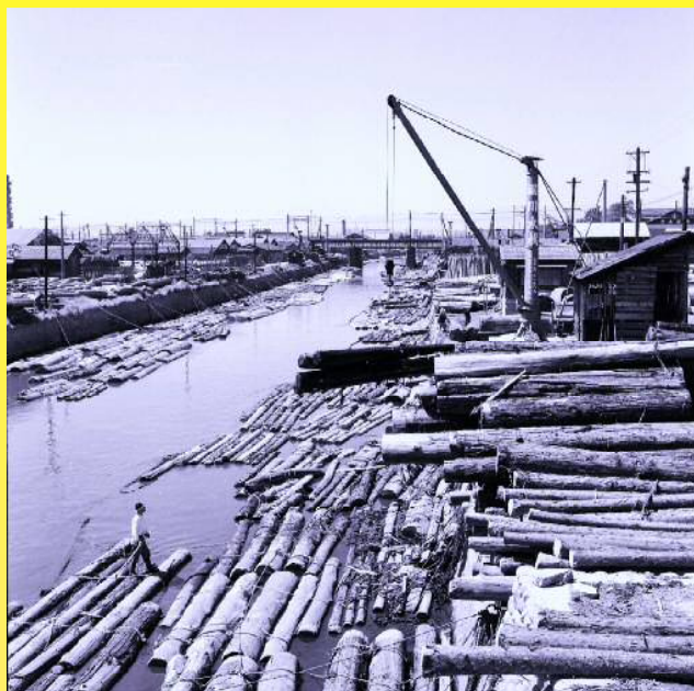
筏師が活躍していた昭和32年頃の堀川