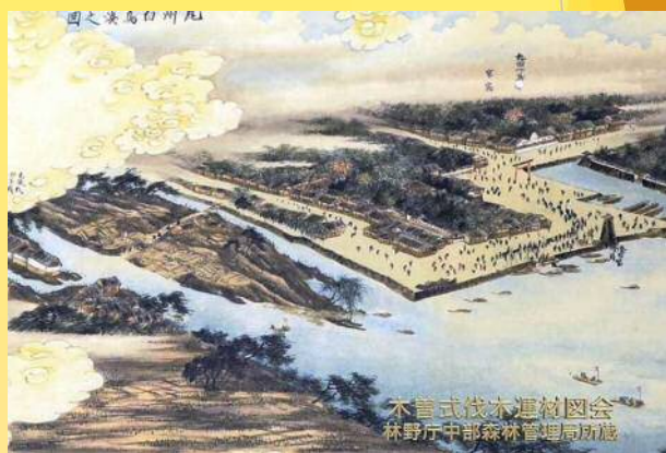
木曾式伐木運材図会（林野庁中部森林管理局所蔵）